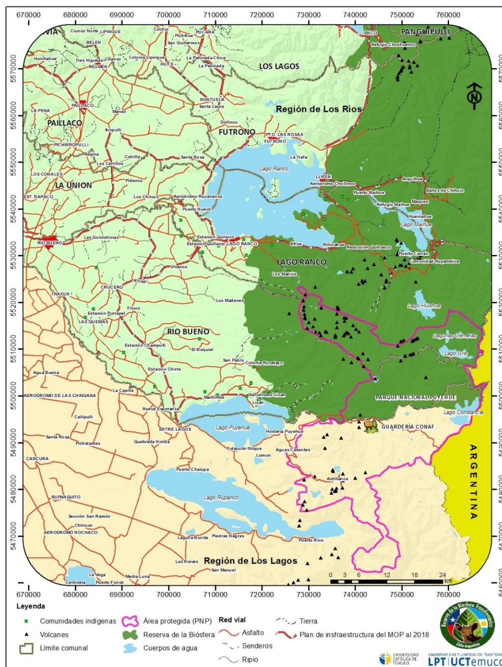
Figura 2. Reserva de la Biósfera, Región de Los Ríos.

Esta iniciativa, ya reconocida por la UNESCO constituye una enorme herramienta de desarrollo para el territorio. En ella, el Parque Nacional Puyehue gracias a su Bosque Templado Lluvioso de Los Andes Australes con 107.000 hectáreas protegidas, fue denominada Reserva de la Biósfera a partir del año 2007 (Araya, 2009; Moreira-Muñoz, 2014), constituyéndose así como un área estratégica en donde es posible vincular las funciones de conservación, desarrollo y logística (CONAF, 2008).